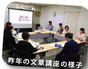
昨年の文章講座の様子