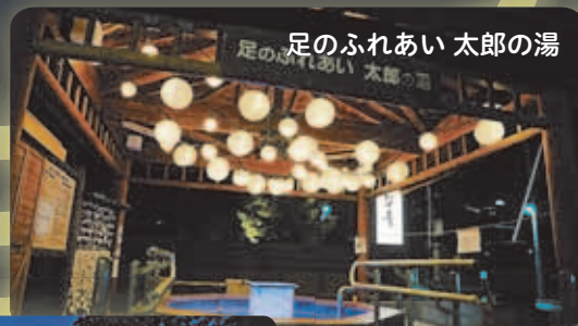
足のふれあい 太郎の湯