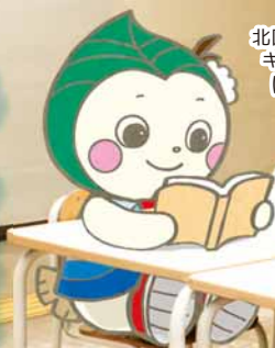
北区民センター3階待合スペース

家庭での消費電力を抑えながら涼しさを分かち合う「クールシェア」は、 環境省が奨励する取り組みです。自宅ではエアコンのある一室に集まり、 外では公共施設や商業施設などの涼しい場所を活用して過ごすことで、 消費電力を削減し、地球にやさしく暑さを乗り切ります。