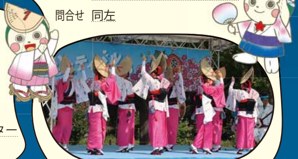
阿波おどりさっぽろしのじ連

日時 7月25日(土) 11:00~17:00 場所 北海道医療大学 あいの里キャンパス駐車場 (あいの里2-5) 問合せ 拓北・あいの里まちづくりセンター (Tel778-2355) ※雨天決行