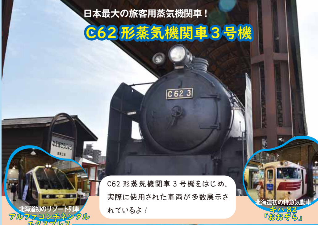
北海道初のリゾート列車 アルファオンチネンタル エクスプレス