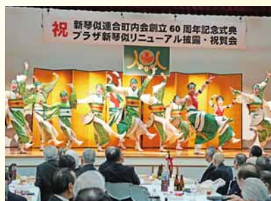
リニューアルした プラザ新琴似 で演舞を披露

チームの特長は、所属する全員でYOSAKOIソーラン祭りに出場することです。勝つことだけを指して少人数でステージに上がるのではなく、全員でひとつのチームとして演舞し、応援してくれる皆さんに感動してもらうことを一番の目標としています。