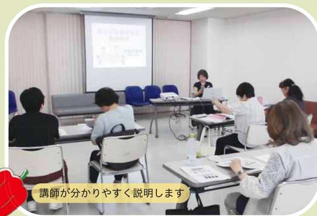
講師が分かりやすく説明します