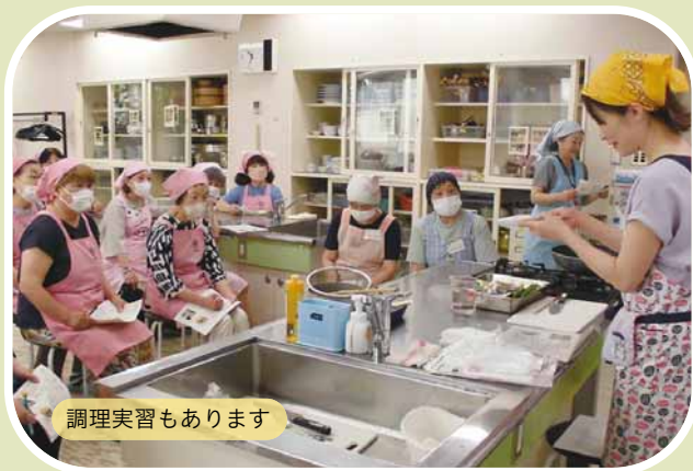
調理実習もあります