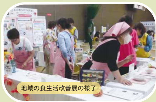
地域の食生活改善展の様子