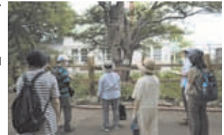
▲自然ウォッチングの様子

申込方法 南区役所3階地域振興課、南区民センター、各地区センター、各まちづくりセンターで配布中の申込書に記入し、5/22(金)までに下記へ郵送(消印有効)