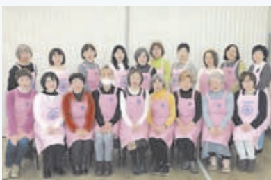
▲南区食改幹事の皆さん

「食生活改善推進員(通称:食改さん)」は、地域で「食を通じた健康づくり」を進める食のボランティア。南区では約70人の食改さんが活動しています。