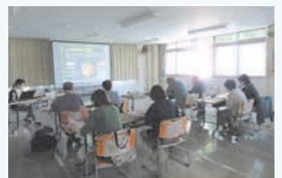
▲食のボランティア講座の様子

南保健センターが実施する「食のボランティア講座～食生活改善推進員養成講座～」を修了後、食生活改善推進員協議会へ入会することで食改さんとして活動できます。