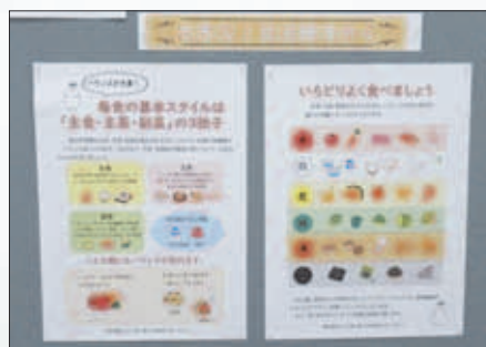
▲以前のパネル展の様子