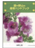
▲南保健センター3階で配布中