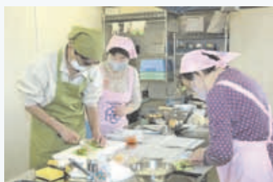
▲地域の方に健康レシピを伝授

料理教室やパネル展、減塩レシピの普及などを行っています。また、講習会や研修会に参加して知識を深め料理のスキルアップを図るほか、学んだ知識を地域の方に伝えています。