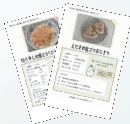
▲手軽に作れるレシピを配布予定！