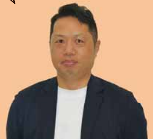
健康・こども課 間瀬職員