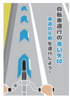
矢羽根型路面表示の詳細