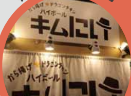
から揚げドラゴンチキン ハイボール キムにい

大きなから揚げとハイボールの組み合わせが抜群で私もお気に入りです。スタッフの方の優しい人柄も魅力的です！