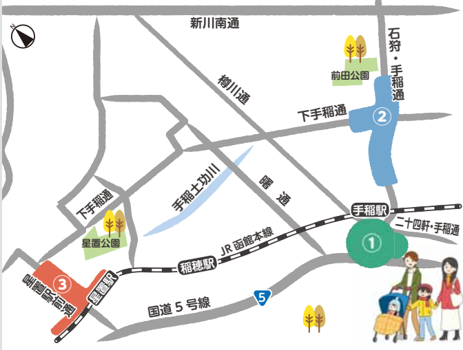
①手稲本町商店街 ②前田中央商店街 ③星置駅前商店街