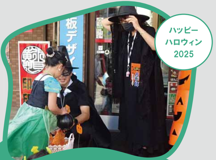
ハッピー ハロウィン 2025