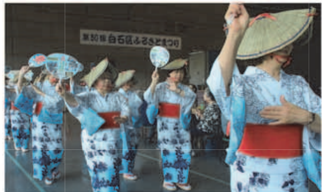
※ヒント: 広報さっぽろ8月号白石区版1ページ