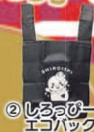
② しろっぴー エコバック