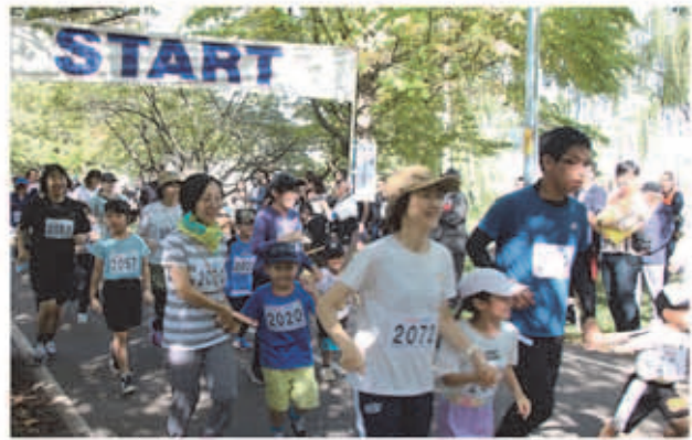
※ヒント: 広報さっぽろ11月号白石区版1ページ