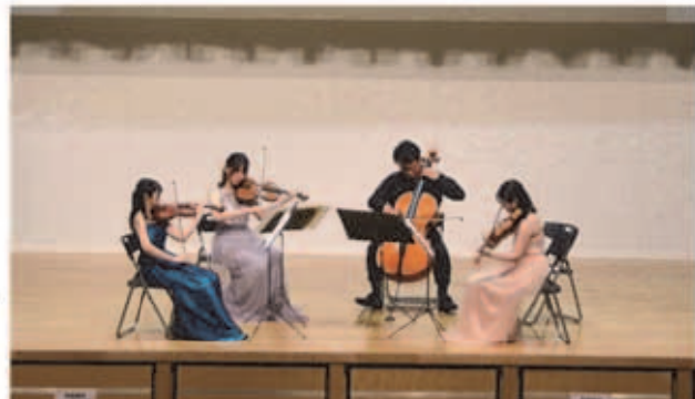
※ヒント: 広報さっぽろ10月号白石区版1ページ