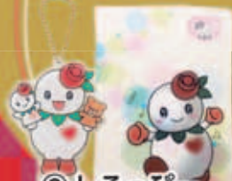
③ しろっぴー キーホルダー& クリアファイル