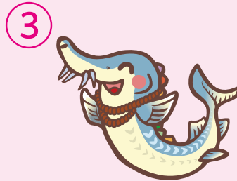
丘珠縄文遺跡 「○○○○○くん」