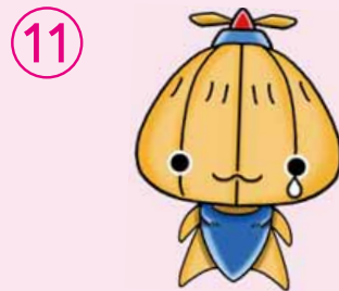
陸上自衛隊 丘珠駐屯地 「○○○○○」