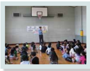
安心・安全に関する取り組み