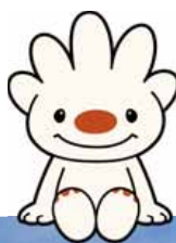
手稲区マスコット キャラクター ていぬ