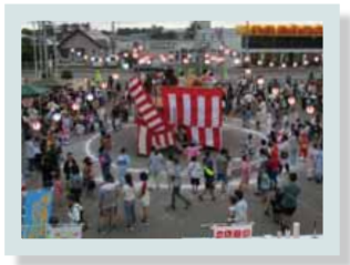
夏祭りなどのイベント