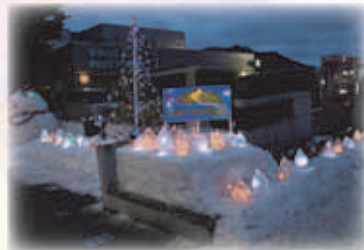
藤野雪あかりの小路