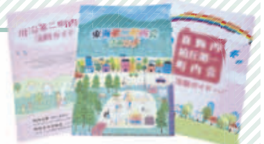
令和6年度の事業で作成した3町内会のガイド

町内会をより身近な存在として認識していただくために、町内会活動の紹介は重要と考えています。そんな折、町内会活動ガイドの作成支援の募集を知り、良い機会だと思い作成することにしました。ガイドには町内会の活動のほか、災害時にも手に取ってもらえるよう、町内会マップや緊急連絡先などの情報も掲載しました。引っ越してきた方を町内会へお誘いするときにも配布したいと思っています。