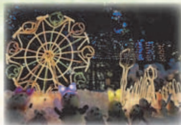
スノーフェスティバル in 澄川-2025-