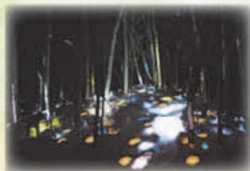
芸術の森地区雪あかりの祭典