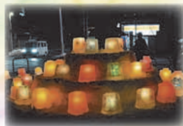
藻岩地区アイスクャンドル