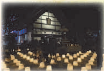
定山溪温泉雪灯路