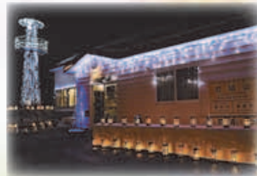
石山スノーファンタジー (まちの灯り)