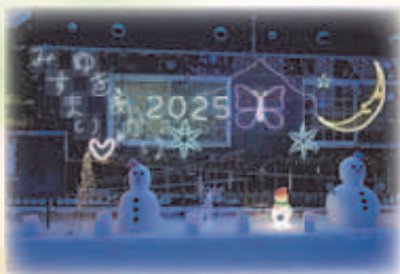
みすまい雪あかり 2025