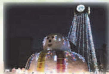
真駒内地区ふれあい「雪あかり」