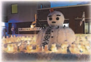
南沢地区冬まつり