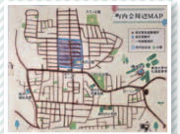
お手製の地図を基に仕上がった温かみのある町内会マップ

表紙やマップは私の手書きの絵を基に作成してもらいました。表紙には町内から見える山と、町内にある南沢公園が描かれ、東海第二町内会の良さが伝わるものになったと思います。