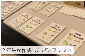
2年生が作成したパンフレット

「どのような活動をしてきましたか？」 工事の段階では、建設現場の見学や仮囲いに子どもたちが描いた絵の掲示を行いました。これは建設中から関わりを持つことで、施設を身近な存在として感じてほしいと企画しました。 完成後の令和6年12月には、屋内広場に2年生が作成した生物観察のパンフレットを配架し、読んだ人にリアクションシールを貼ってもらいました。また、同じく屋内広場で3年生が調べた鉄西地区の魅力発表会も開催し、保護者だけでなく、地域の人にも楽しんでいただきました。 これらの企画では、子どもたちが実際に地域の人の反応を知ることができ、