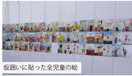
仮囲いに貼った全児童の絵