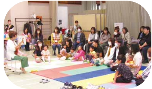
30 周年イベント (2024.9 開催)