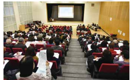
全体研修会 (2025.2 開催)