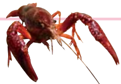
▲アメリカザリガニ

どんな生き物も責任を持って飼おう。中でも、アメリカザリガニやアカミミガメなどの外来生物を野外に放すことは、元々すんでいる生き物に影響を与えるため、法律で禁止されているんだ。ウチダザリガニなどの特定外来生物は、飼うことも禁止されているよ。