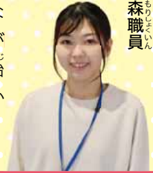
上森職員 あいまる さっぽろ

あいまる さっぽろには、飼い主が飼えなくなったり、捨てられたりした犬や猫がたくさんやって来ます。ペットを飼い始める前も、飼い始めてからも、命を預かる責任をしっかりと考えましょう。