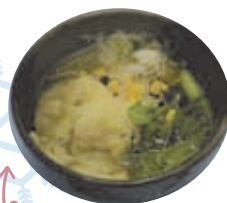
塩ワンタンメン (1,200 円)

ダブルカットカレー (1,650 円) は カット 2 枚のスペシャル メニューです。