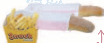
あげパン (280 円) など おやつも充実！