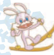
札幌藻岩山スキー場 所 藻岩下 1991 ☎ 581-0914