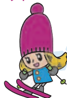
札幌国際スキー場 所 定山溪 937 ☎ 598-4511