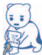
札幌市雪対策 広報キャラクター ゆきだるマン