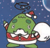
西区環境キャラクター さんかくやまベエ