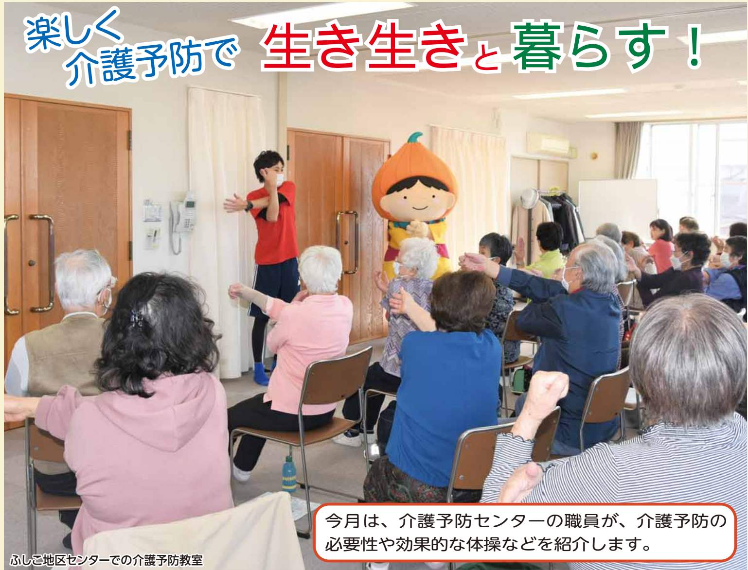
ふしこ地区センターでの介護予防教室

今月は、介護予防センターの職員が、介護予防の必要性や効果的な体操などを紹介します。