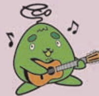
西区環境キャラクター さんかくやまべ