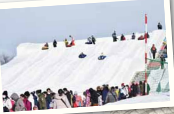
2024 さっぽろ雪まつり つどーむ会場の様子

↑ 海外客にも大人気の撮影スポット「ウェルカム雪像」は、栄東地区の町内会や子どもたちが制作しています。