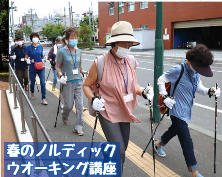
春のノルディック ウォーキング講座

▼6/28(金)開催!詳しくは今月の情報プラザ(KITA 5ページ)をチェック!