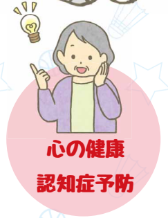
心の健康 認知症予防