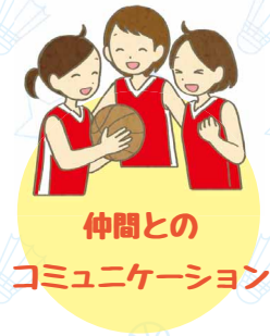
仲間との コミュニケーション

目標に向けて仲間と協力したり、楽しさを共有するなど、スポーツを通じたコミュニケーションで人とのつながりが生まれます。また、運動は体力の維持・向上だけでなく、心も健康にし、認知症や要介護状態を予防し、健康寿命延伸にもつながります。