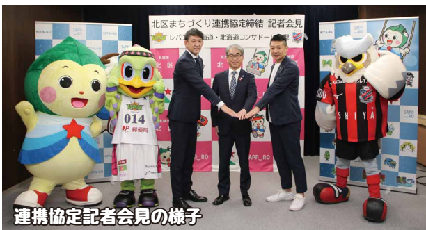
連携協定記者会見の様子