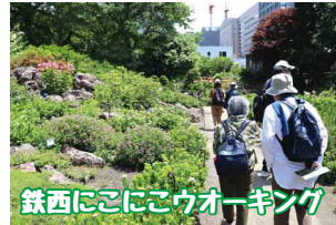
鉄西にここウォーキング