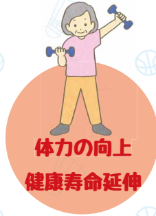
体力の向上 健康寿命延伸