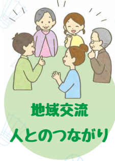
地域交流 人とのつながり