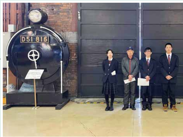
北海道鉄道技術館の詳細はこちら→