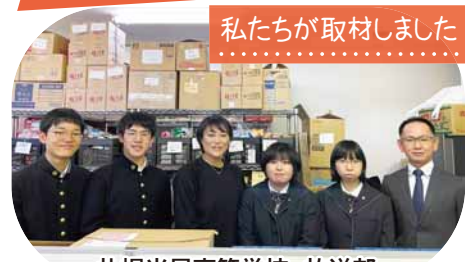
私たちが取材しました

学校の行事で参加したボランティアで、収穫した野菜を子ども食堂に届ける時に「イコロさっぽろ」さんをお願いした経験から、フードバンク活動を取材しました。