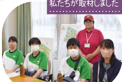
北海道札幌東豊高等学校 放送局

「い〜すトリー」は「さっぽろ村ラジオ (FM81.3MHz)」で毎月第4土曜日 13時15分〜29分に放送しています。