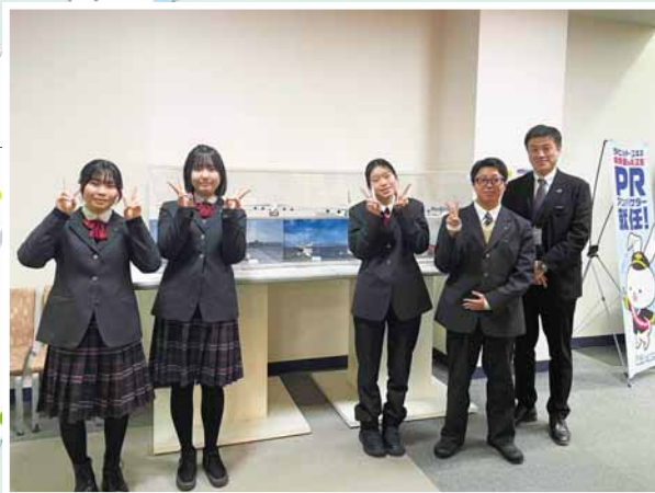
札幌丘珠空港の詳細はこちら→