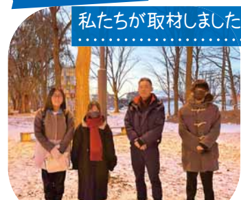
私たちが取材しました

緑が豊かな住宅地のオアシスといわれている美香保公園と、1972年に冬季オリンピックのフィギュアスケート会場として利用された歴史のある美香保体育館を取材しました。