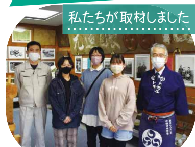
私たちが取材しました

1918年に建設された赤レンガ造りの醤油蔵は今も現役で、100年以上前からほぼ変わらない製法でしょうゆを作り続けていることに興味が湧き取材しました。