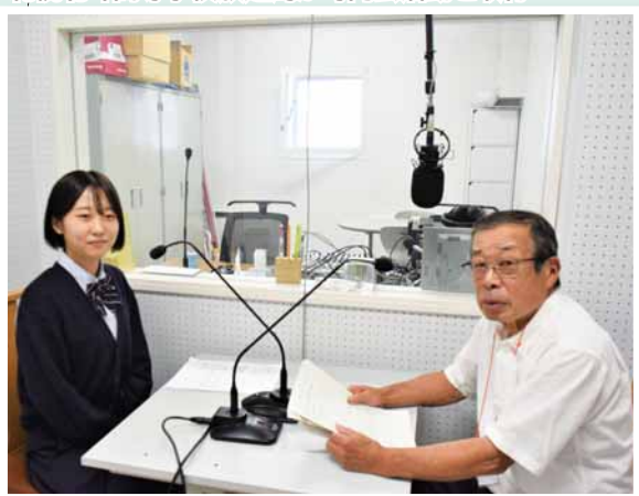
町内会検索、加入希望の連絡はこちら→