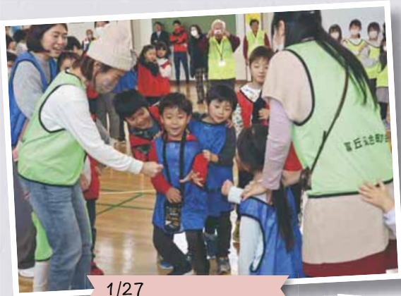
1/27 冬のふれあいまつり (富丘西宮の沢地区)

秋にはハロウィン、冬には百人一首大会など、子どもも大人も楽しんで遊べるイベントが盛りだくさんでした。