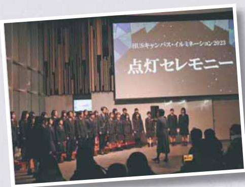
12/1 HUS キャンパス・イルミネーション点灯セレモニー

寒い冬でも心が温かくなるような、イルミネーション・アイスキャンドルの光を楽しむイベントが数多く開催されました。