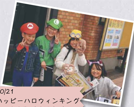
10/21 ハッピーハロウィンキング サリ商店街 (手稲地区)