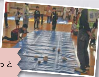
10/14 てつほくあそびねっと (手稲鉄北地区)