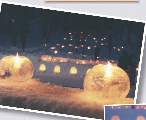
1/20 雪の花あかり (星置地区)

いつ発生するかわからない災害に備えて、寒い秋や冬でも訓練や研修が盛んに行われています。