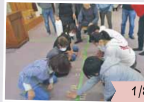
1/8 百人一首大会 (稲穂金山地区)