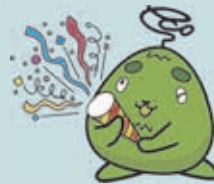
西区環境キャラクター さんかくやまべえ