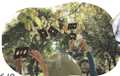
親子でエコキッズ・プログラム in Autumn

西区の小学生以下の子どもを対象に、琴似発寒川や五天山公園などの西区の自然を生かして、楽しく遊びながら、環境について学ぶ活動です。昆虫や植物を観察する自然観察会や、川や川辺の生き物を観察する水生生物観察会などを行っています。