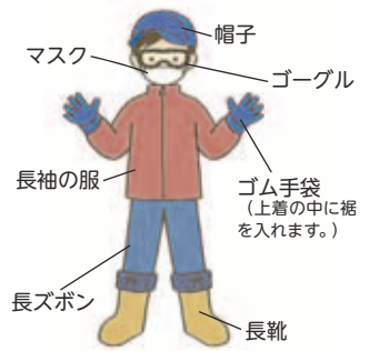
〈駆除を行うときの服装〉