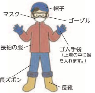
〈駆除を行うときの服装〉