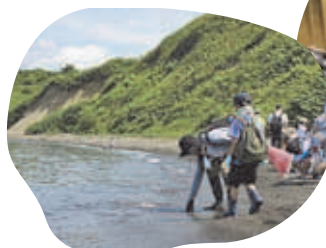
親子で環境満喫バスツアー