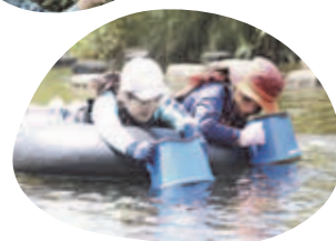
西区子ども自然学校 in Summer