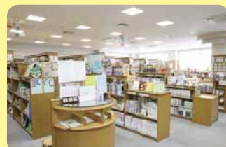
▲▼もいわ地区センター図書室

※すみかわ地区センターには図書室がありませんが、澄川図書館（澄川4条4丁目5-6）に近接しています。