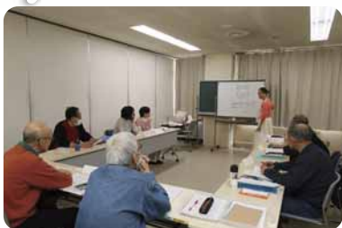
英会話サークル メープル イングリッシュ クラブ 「Maple English Club」の皆さん