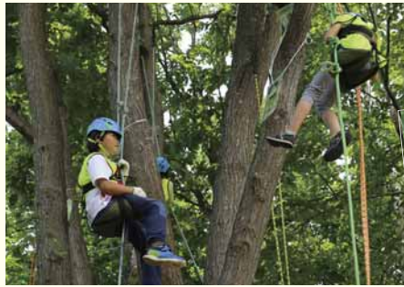
▲スリル満点！ツリークライミング