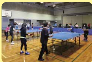
▲藤野地区センター