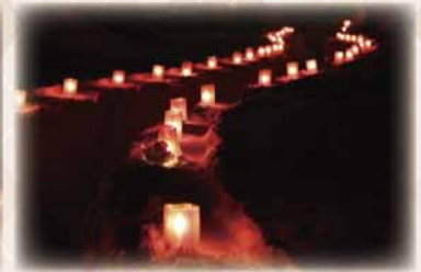
芸術の森地区雪あかりの祭典