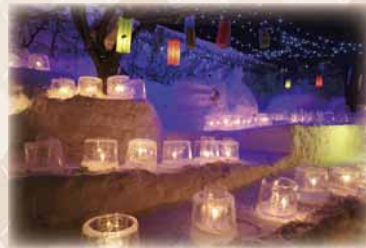
藻岩地区アイスクャンドル