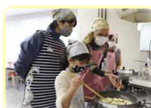
冬休み親子料理教室 (1月9日)