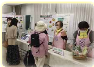
健康寿命延伸イベント 南区健康デー 2023 (2023年9月29日)

南区の健康寿命延伸イベントではパネル展を開催。来場者へ食生活のアドバイスなどを行いました。また、地域の高齢者向けの食生活教室などで、食生活について見直すきっかけづくりをしています。