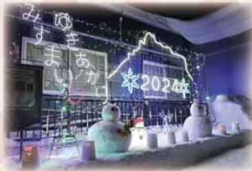
みすまい雪あかり