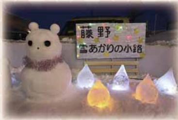
藤野雪あかりの小路