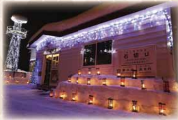
石山スノーファンタジー(まちなかの灯り)