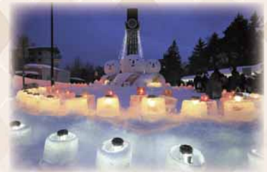
真駒内地区ふれあい「雪あかり」