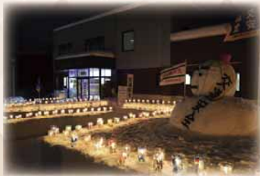
南沢地区冬まつり