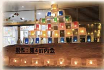
藻岩下やさしい雪あかり