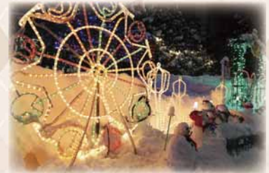
スノーフェスティバル in 澄川-2024-