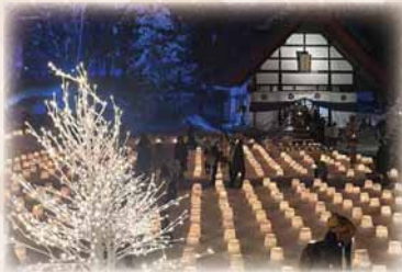
定山溪温泉雪灯路