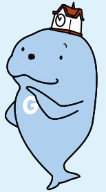
広報さっぽろキャラクター ギュウ太