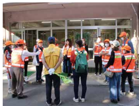
登校時の活動の様子▶

を選んで、道を聞かないでしようか？しかめっ面の人や、身だしなみが整っていない人にわざわざ道を聞かないでしょう。子どもだって同じです。だから、あいさつしてもらえなかったら「しかめっ面になっていなかっただかな」「身だしなみは大丈夫です。せっかく活動するんだから、声を掛けやすい、子どもたちにとって頼れる大人でありたいです。」「子どもたちにも見られているんだ」ということを忘れずに、自分を律して、これからも活動を続けていきたいと思っています。