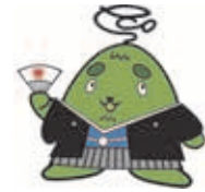
西区環境キャラクター さんかくやまベエ