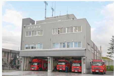
▲現在の豊平消防署(月寒東1条8丁目)

豊平町消防本部は、昭和 23 (1948) 年、消防組織法に基づき月寒二区 (現在の月寒中央通 5 丁目) に置かれました。この高さ 20 m の望楼は、昭和 33 (1958) 年の設置から同 48 (1973) 年までの間、異常な煙や火の手が上がっていないかなど、地域の安全を守る役割を果たしました。