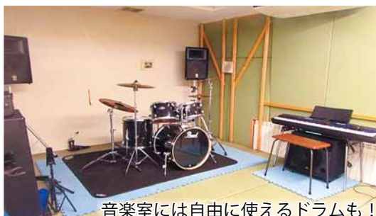
音楽室には自由に使えるドラムも！