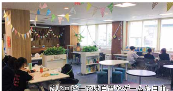
広いロビーでは自習やゲームも自由。

館内施設の一部をご紹介します！ （音楽室・体育室・活動室の利用には事前の予約と利用料金が必要です。）