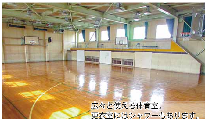
広々と使える体育室。更衣室にはシャワーもあります。