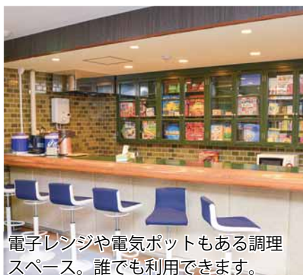
電子レンジや電気ポットもある調理スペース。誰でも利用できます。

地下鉄東豊線豊平公園駅より徒歩3分の好立地。会議や、ダンスの練習などでも利用できる3つの活動室の他、音楽室や体育室があります。幅広い活動に対応しており、施設は年齢問わず誰でも利用することができます。ちょっとした集まりや、体を動かしたいときなどはもちろん、お一人での利用も可能です。こんなことにも利用できるの？と思ったときは、気軽にお問い合わせください。