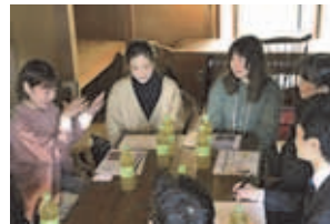
ピクニックフェス実行委員会のインタビューの様子

現在、「宮の沢でもっと活用してみたい場所はどこですか？」「歩きたくなる、外に出たくなる宮の沢にあなたが欲しい工夫は？」などの意見を募集中ですので、ぜひご参加ください。