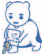
札幌市雪対策 広報キャラクター ゆきだるマン

地下鉄・JR駅周辺の人通りの多い交差点などに、滑り止め材(砂)が入った砂箱を設置