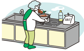
料理の味が変わった