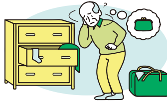
財布や鍵などを探そうとすることが増えた