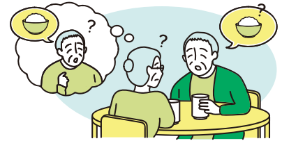
何度も同じことを聞く