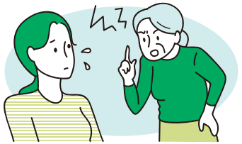
ささいなことで怒りっぽくなった