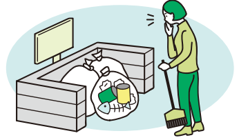
ごみの分別を間違える