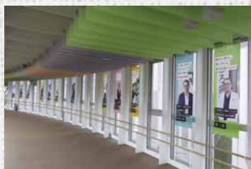
▲アクティブリンクでの展示

また、サンピアザ1階「光の広場」でアンケート調査を実施し、地域住民の「やってみたい！」という声を集めました。いただいた意見は、今後の新さっぽろのまちづくりに生かしていきます。