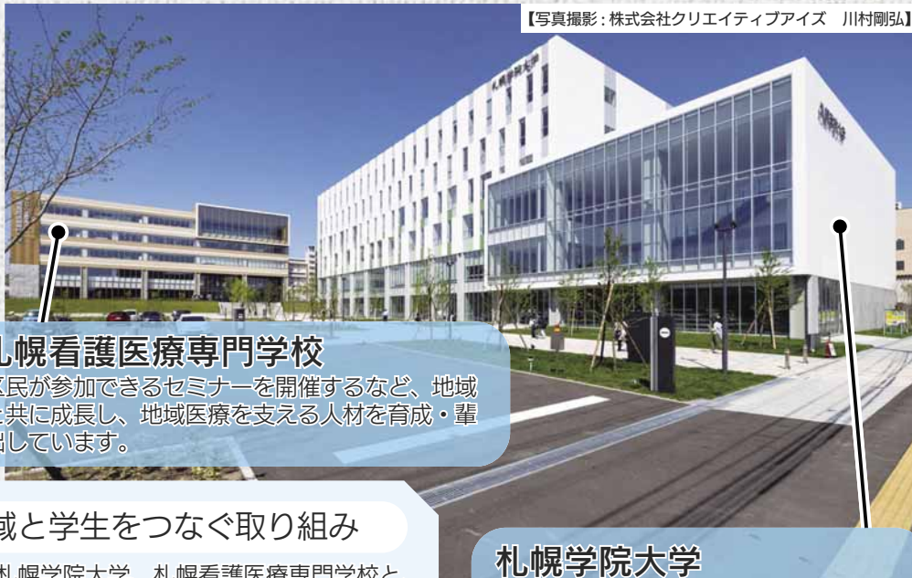
【写真撮影：株式会社クリエイティブアイズ 川村剛弘】

専門学校と大学が2021年4月に開学しました。新さっぽろに若者を呼び込むきっかけとなつてにぎわいを創出するとともに、多くの世代の方々が集う場となり、さまざまな地域活性化に貢献しています。