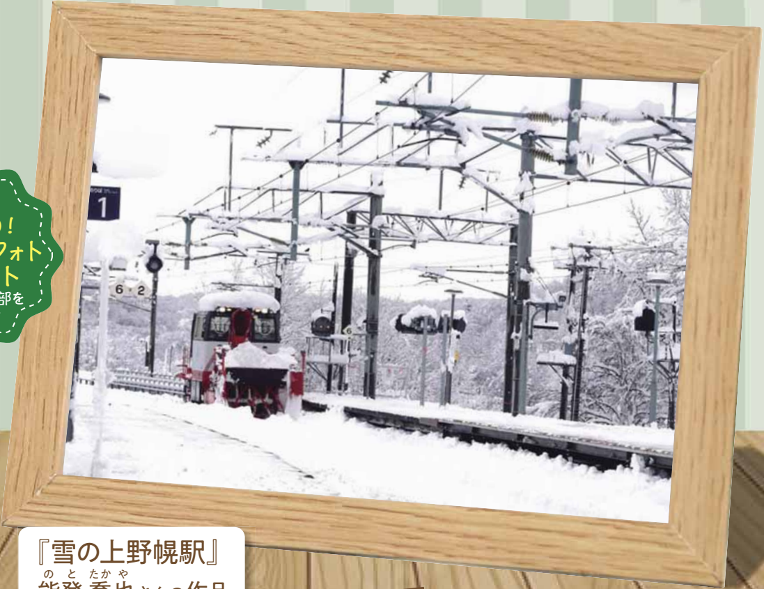
『雪の上野幌駅』 のとたかや 能登 喬也さんの作品