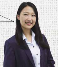
大和ハウス工業株式会社 エリアマネジメントグループ

新さっぽろのまちづくりは開発して終わりではなく、開発事業の後も地域の方々と意見を交わして、今後もこの地域の活性化に貢献していきたいと考えています。まちが循環していく社会の実現を目指してさまざまな取り組みを進めていきます！