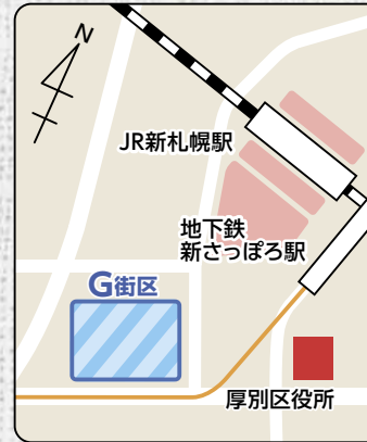
▲新さっぽろ地域周辺図

図書館やカフェテリアなどを一般開放している他、学生による地域との交流の取り組みも行われるなど、地域の活性化に貢献しています。