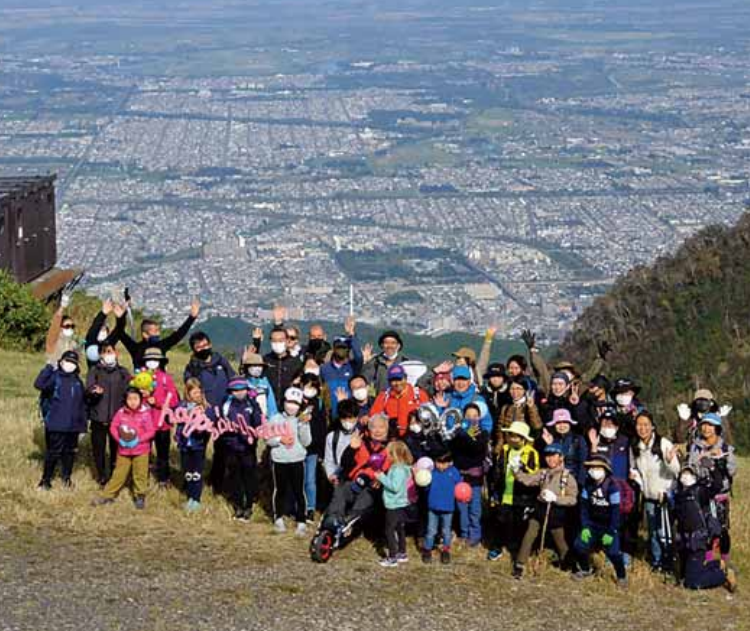
90歳の誕生日を迎える2022年10月には、家族・仲間たちとともに手稲山に登り、山頂付近で誕生日のお祝いをしたそうです。

2019年11月、手稲区制30周年イベントでも、手稲山の魅力を熱く語っていただきました。