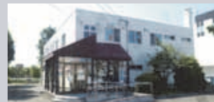
動物管理センター本所 (西区八軒9東5) 主な業務：市民相談対応や動物取扱業に関する業務など