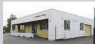
動物管理センター福移支所 (北区篠路町福移) 主な業務：動物の収容・管理・譲渡、ペットの火葬など