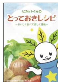
▲ピカットくんの とっておきレシピ