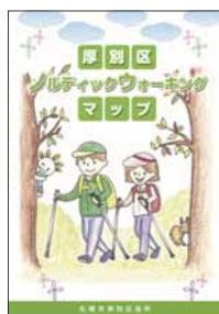
▲厚別区ノルディック ウオーキングマップ