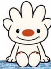
手稲区マスコット キャラクター ていぬ