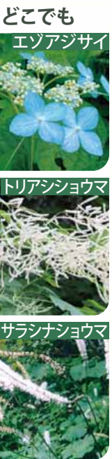
どこでも エゾアジサイ トリアシヨウマ サラシヨウマ

急斜面ですが階段が付いています。 手稲本町入口から登り、ここから金山入口へ下りるコースもおすすめ。