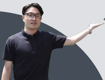
豊平峡ダム管理支所 なかい 職員

豊平峡ダムは、おいしい水を蓄える市民の水がめとして、札幌市の水道水の約半分を賄っています。また、道内で唯一、観光放流を行っているダムでもあり、展望台からの風景は絶景です。ぜひお越しください！