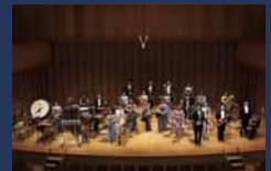
札幌管楽ゾリステン (管楽器)