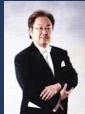
おかざき まさじ 岡崎 正治 (テノール)