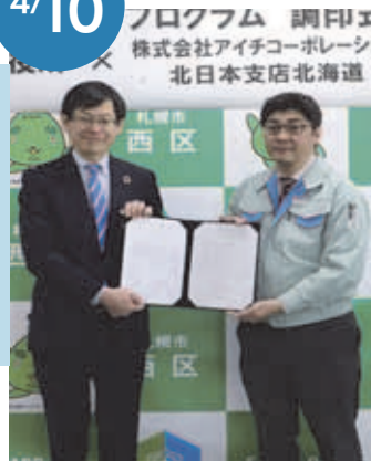
▲株式会社アイチコーポレーション 北日本支店北海道