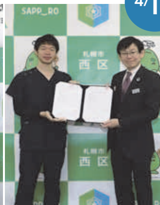
▲宮の沢スマイルレディース クリニック