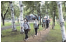
ノルディックウォーキング講習