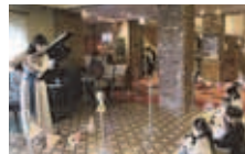
親子向けコンサート