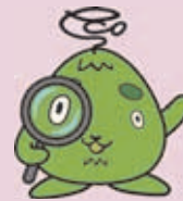
西区環境キャラクター さんかくやまべえ