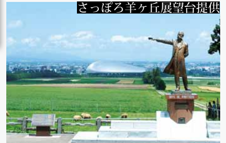
▲クラーク像と札幌ドーム