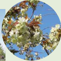
◀前田森林公園のギョイコウ