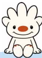
手稲区マスコット キャラクター ていぬ