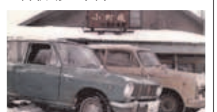
▲発寒商店街の始まりといわれている光永商店

園の樹木のそばに万葉集の歌碑が23基立っているのを知っていますか?あれは市民からの提案を受けて1994(平成6)年に建てられたものなんでしょう、提案したのがどんな人かずっと気になっていてね。そんな中、新元号「令和」の出典元として万葉集が再注目されたことを受けて、歌碑の紹介展を開催したんです。するとそれを知った親族の方から連絡があり、ご本人と手紙のやり取りができるまでになりました。そうやって人と人となつていくのが本当に面白くてね。