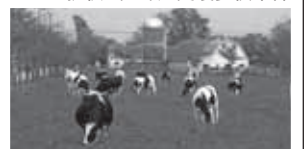
▲札幌景観資産に指定されていた三谷牧場の牛舎・サイロ