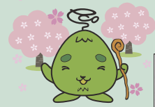
西区環境キャラクター さんかくやまベエ