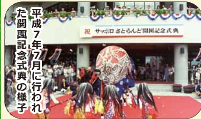
平成7年7月に行われた開園記念式典の様子

東区の昔を振り返る「東区今昔」。今回は、「さとらんど」を紹介します。さとらんどは、「人と農業・自然とのふれあい」、「都市と農業の共存」をテーマに、農業に対する理解を深め、食への関心を高めることを目的として、平成7年（1995年）にオープンした田園テーマパークです。60ヘクタール（札幌ドーム10.5個分）を超える敷地には、牧場やパークゴルフ場などのレジャー施設があるほか、季節野菜の収穫体験やバターやソーセージの手づくり講座など、さまざまな体験を楽しむことができます。名前の「さとらんど」は、ふる里の「さと」とランド（大地）の「らんど」の造語で、市民に愛される里づくりを願って名付けられました。