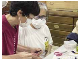
▲「古布で猫のフローチづくり」の様子

自転車修理教室や古着リメイク講座、簡単工作教室など、暮らしに役立つ教室や講座を開催しているほか、施設内にはごみ減量の啓発パネルを展示しています。また、イベントで福祉バザーやフリーマーケットなどを実施しています。