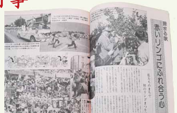
▲喜びや楽しさが伝わる誌面（昭和51年11月号）

区のシンボルである環状通のリンゴ並木。その収穫を祝うため、昭和51（1976）年に誕生したのがリンゴまつりです。この行事は平成11（1999）年まで続き、多い年には約8万人もの人が集まりました。リンゴの収穫はもちろん、パレードや運動会など、開催前から当日まで、地域のボランティアなど多くの住民の力で支えられ、「ふるさとのもまつり」として親しまれました。