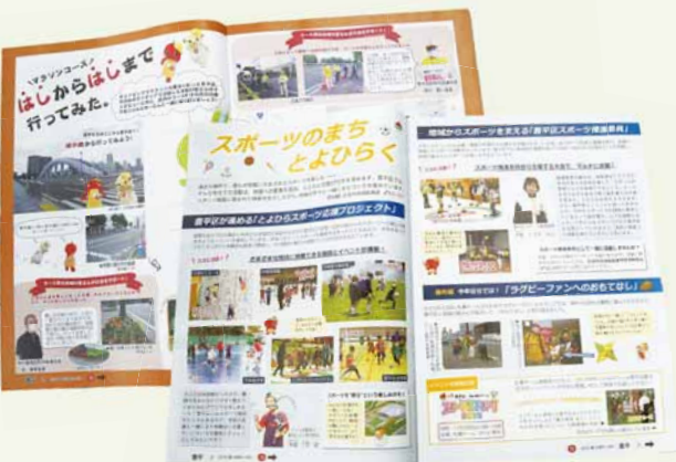
▲スポーツに関連するさまざまな取り組みを特集 上（令和3年9月号）下（令和元年11月号）