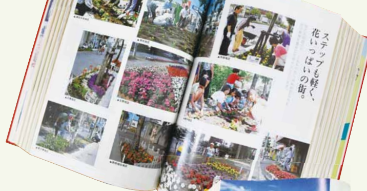
▲美しい花壇がずらり （平成3年8月号）

とよひら HANA—LAND 事業（平成2年～） 豊平区を花に包まれた美しいまちにするこの事業は、多くの方の協力を得て、現在も続いています。公共施設周辺の花植えの他、羊ヶ丘通など大きな通りの歩道や中央分離帯に花を植える計画が進められるに従い、まちには花の手入れをする人がよく見かけられるようになりました。区制施行20周年を迎えた平成4（1992）年にはペチュニアが区の花に制定。平成5（1993）年にはまちを花で飾っている人や団体を表彰する花コンテスト、区内のスクールバンドが演奏するフラワーコンサートが始まりました。今、私たちの生活に溶け込んでいる「花のある風景」は、地域の人びとの手によって受け継がれてきた大切な宝物です。