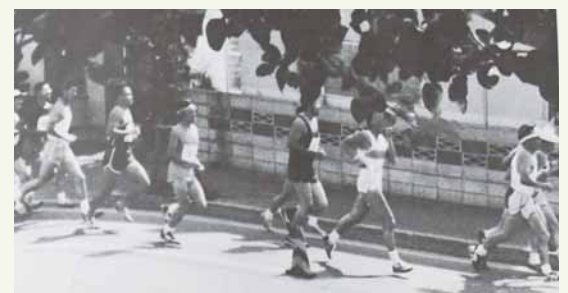
▲この年、ビデオ装置を導入し、参加者全員のタイムを記録（昭和62年10月号）

リンゴまつりから遅れて昭和58（1983）年に始まったのが、リンゴ並木の美しい風景を楽しみながら走るりんごマラソンです。多い時には約1,000人ものランナーが健脚を競ったこの大会は、当初リンゴまつりより少し早い時期に行われていましたが、平成3（1991）年より同日開催となり、この2つの行事が行われる日は多くの参加者が秋の空の下に集って、催しを楽しみました。