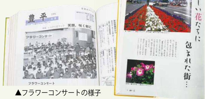
▲フラワーコンサートの様子 （平成6年8月号）