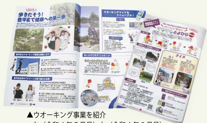
▲ウォーキング事業を紹介 左（令和4年7月号）右（令和4年9月号）

区が誕生して50年を迎えた昨年より、「スポーツ」と「健康」を新たなキーワードに、ウォーキングをはじめとする身近な健康づくりに取り組んでいます。各種スポーツイベントの開催はもちろん、区内各所を巡るウォーキングマップを改訂した他、ウォーキングコースに関連したクイズを出題し、区内を歩いてもらう「てくてくとよひら」を企画。この他、健康増進に関する施策も進めています。魅力あふれるこの豊平区を、次世代につなげていくための新たな歩みは、今まさに始まったばかりです。