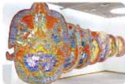
宮田彩加《MRI SM20110908》2016-

1924年から現在までの100年間の アートに注目した企画展示を行いま す。北海道にゆかりのある作品にも、 ぜひ注目!