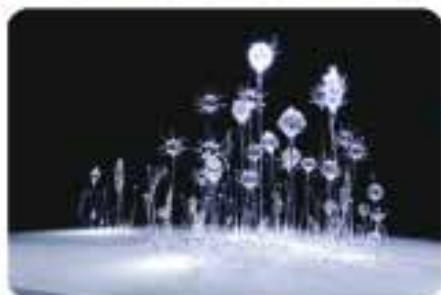
青木美歌《her songs are floating》2007

注目アーティストによる作品のほか、 「LAST SNOW」をテーマにした世界 初公開作品を展示。100年後の未来 を一足先にのぞける場です。