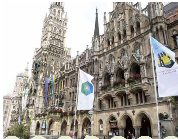
▲姉妹都市50周年を記念し、市庁舎に札幌市の市旗が掲揚された