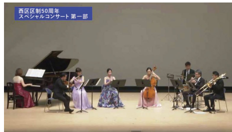
▲PMF(パシフィック・ミュージック・フェスティバル札幌)修了生らによる息の合った演奏