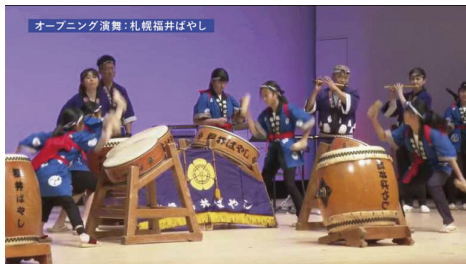
▲西野地区の郷土芸能「福井ばやし」の力強い迫力の演舞で幕開け